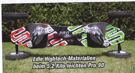
Edle Hightech-Materialien beim 5,2 Kilo leichten Pro 90

Der Begriff „Pop“ passt nur zu gut zu den beiden hier vorgestellten ATB-Decks. Das Deck des Pro 90 wird in einer Kohlefaser-Fiberglas-Sandwichbauweise hergestellt, welche einen hervorragenden Flex und somit auch Pop bietet. Trotzdem schafft es das Comp 90, den Flex mit seinem laminierten Deck noch zu überbieten. Auf diesen ATBs wird man auch bei höheren Sprüngen gewiss sanft und sauber abgesetzt. Durch den großartigen Flex der beiden Boards werden auch Unebenheiten im Boden perfekt abgefedert. Das Pro 90 hat ein außerordentlich kleines Deck, was es