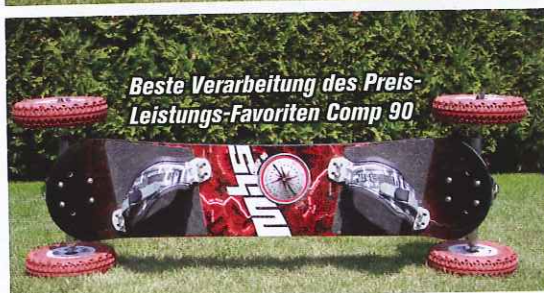
Beste Verarbeitung des Preis-Leistungs-Favoriten Comp 90